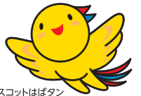
兵庫県マスコットはぼタン

ミドル世代を積極的に正社員採用している兵庫県内の企業が参加する合同企業説明会を開催します。 経験者を求める求人から経験不問の求人まで、様々な業種の求人と出会うチャンスです。 新しい仕事にチャレンジしたい概ね35歳以上54歳以下の方の参加をお待ちしております。